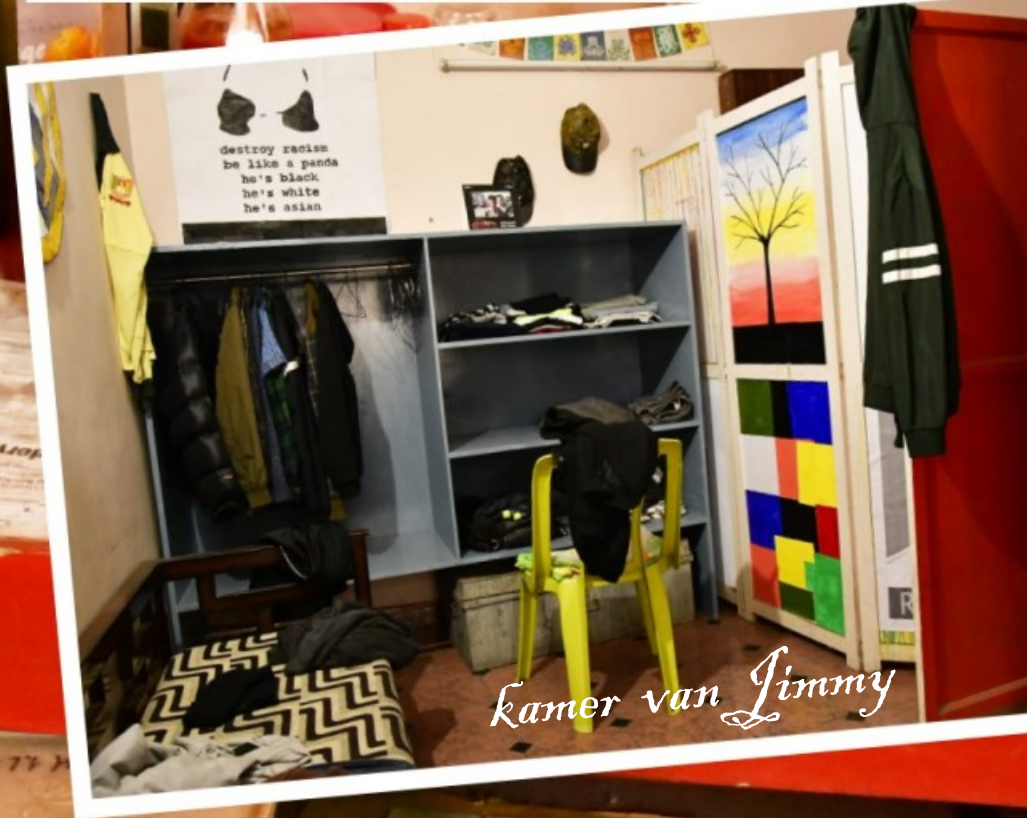
kamer van Jimmy